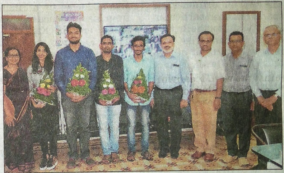
The students who have been selected for higher education in foreign universities being felicitated by DKTE officials

SUK invites applications for PG diploma in E-business: Shivaji University, Kolhapur (SUK) has invited applications for the PG diploma in E-business by Au-